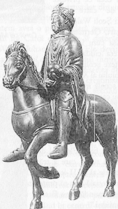
Carol cel Mare