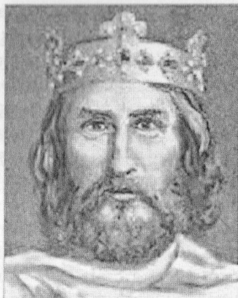
Carol cel Mare la 26 de ani